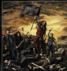
Birth of a Nation